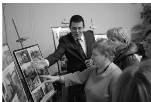
Wystawa w Starostwie Powiatowym w Sztumie.

Wystawa zdjęć pt. „Tradycja szlachecka na Powiślu” prezentowana była w pod koniec grudnia w Starostwie Powiatowym w Sztumie, a w styczniu 2015 r. w Zespole Szkół im. Jana Kasprówicza w Sztumie.