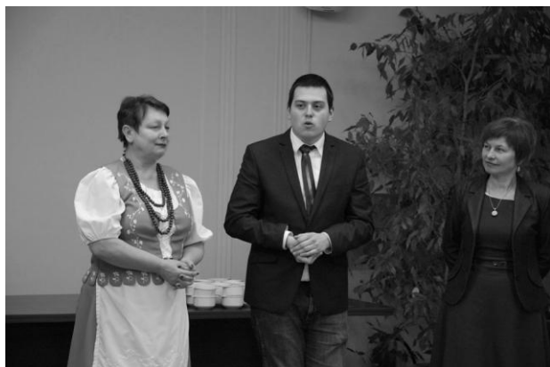
Życzenia noworoczne złożyli przedstawiciele organizacji pozarządowych.

Kilka sztumskich organizacji, Młodzieżowa Grupa Działania, KGW Czernin, Stowarzyszenia: Przyjaciele Dzieci, Aktywny Czernin i Dar Serca, 29 grudnia 2014 r. wspólnie zorganizowali spotkanie noworoczne organizacji pozarządowych (odbyło się ono dzięki finansowaniu ze środków MPiPS z Programu Fundusz inicjatyw Obywatelskich w ramach Świątecznej Akcji "W sieci NGO" organizowanej przez Instytut Równowagi Społeczno-Ekonomicznej). Udział w nich wzięli działacze społeczni oraz zaproszeni goście.