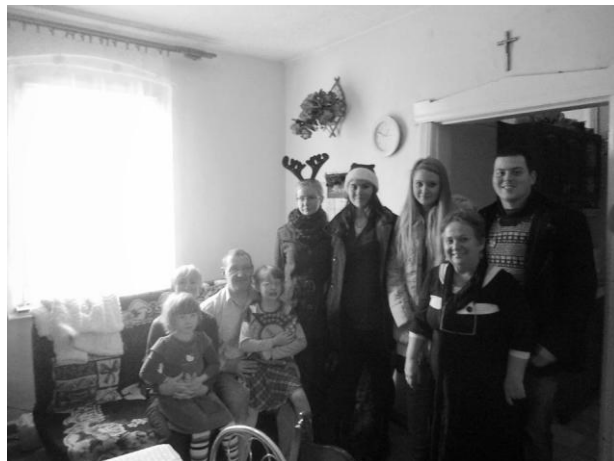
Szlachetną Paczkę przekazali przedstawiciele MGD oraz wolontariusze z Zespołu Szkół w Sztumie.

Młodzieżowa Grupa Działania przyłączyła się do akcji Szlachetna Paczka. Zbiórka trwała dwa tygodnie, a przez ten czas wszyscy pokazaliśmy, że pomaganie jest fajne!