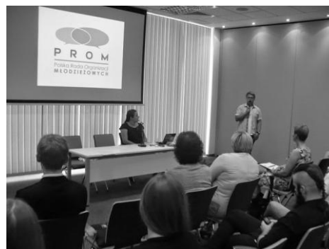
W konferencji uczestniczyła młodzież z różnych części województwa pomorskiego.