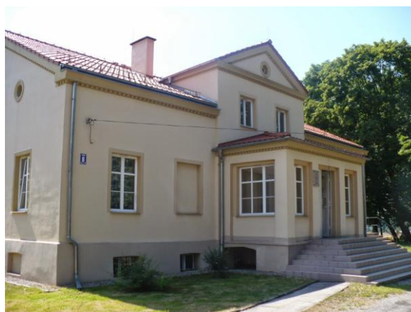
Dworek jest obecnie w dobrym stanie, gdyż został niedawno odrestaurowany przez Agencję Nieruchomości Rolnych.