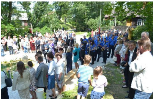
2 Mieszkańcy Sulkowic na uroczystym otwarciu źródelka

Zainteresowanie mieszkańców, od początku nie małe, z czasem tylko rośnie. angażowali się wszyscy: jedni sprząтали staw, inni przynosili prowiant pracującym. Źródelko było głównym tematem rozmów. Inicjatywą zainteresował się również jeden z lokalnych