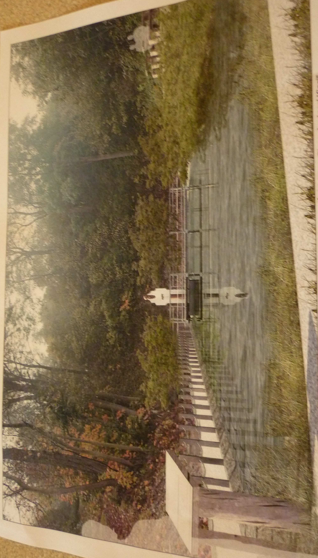
Koncepcja zagospodarowania jaru z "Cudownym Źródłem Błogosławionej Kingi"