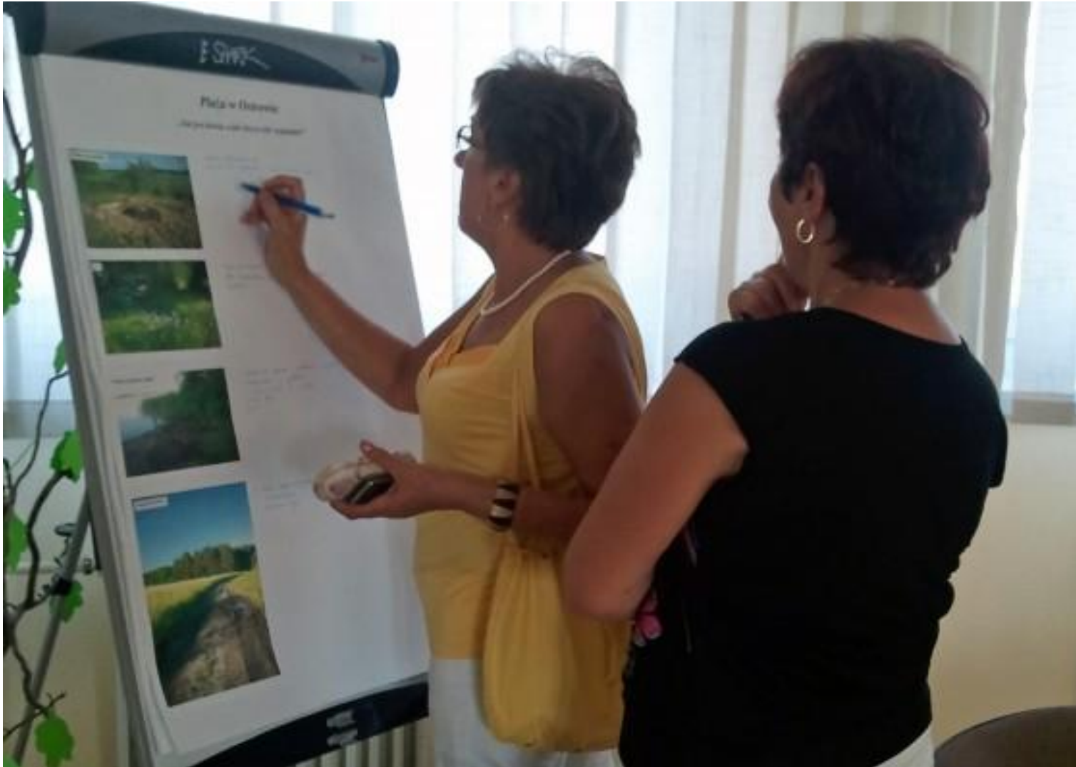
Wykorzystanie zdjęć przestrzeni. Masz Głos Masz Wybór 2012, Płużnica