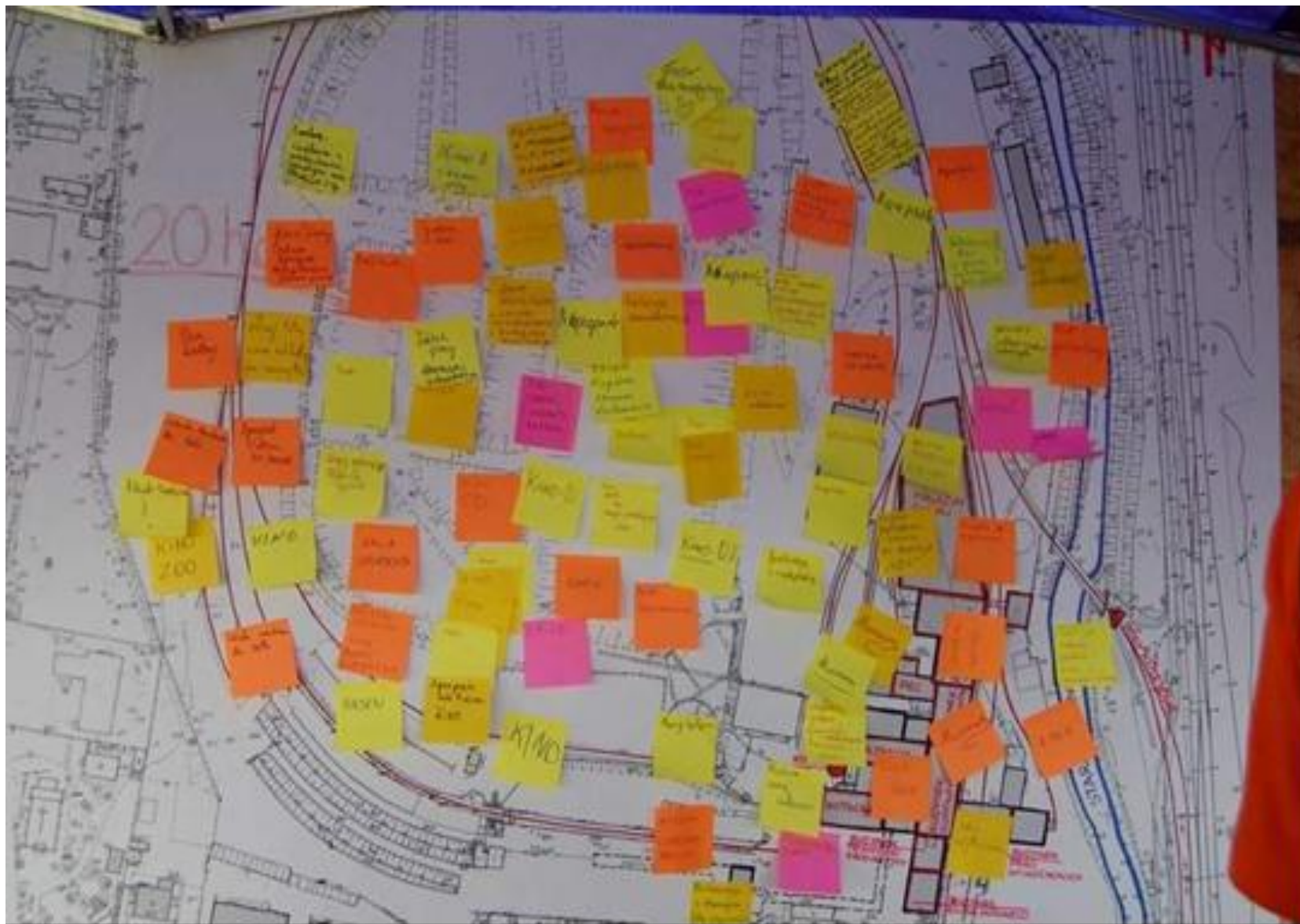
Praca z mapą. Strefa Cukru, Pruszcz Gdański 2012