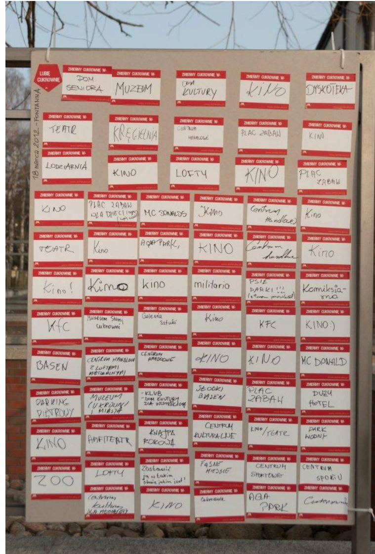
Wlepki. Strefa Cukru, Pruszcz Gdański 2012