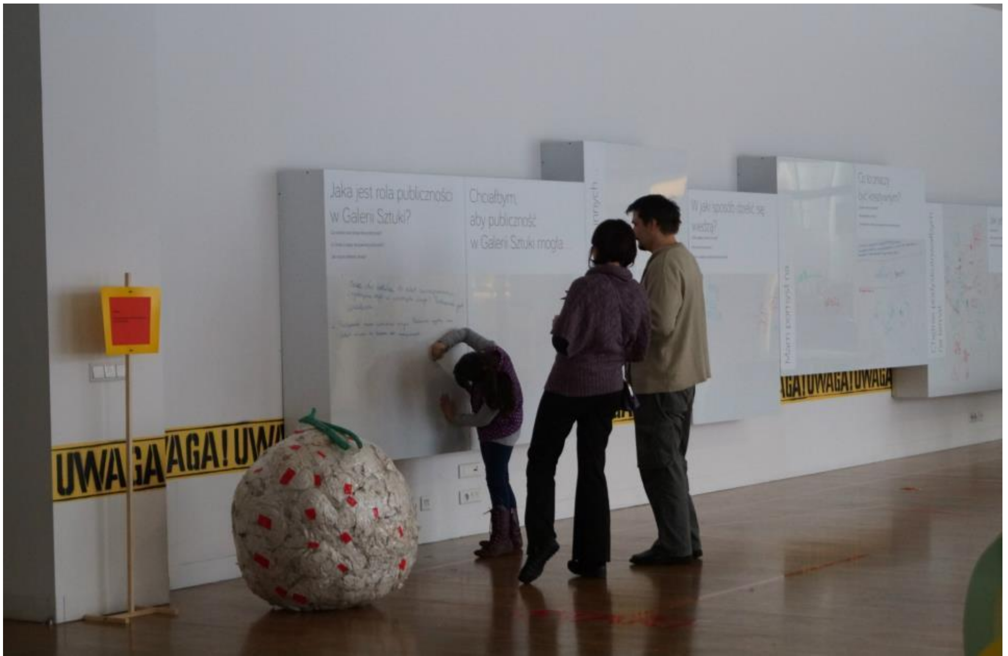
Tablice do zbierania danych. Projekt Zrób to z nami!, Centrum Sztuki Współczesnej w Toruniu 2013.