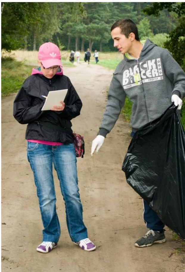
MGMW 2012, Płużnica

➤ Następnie zadaj kilka dobrze dobranych pytań, żeby poznać opinię ogółu mieszkańców – sondaż, ankieta.