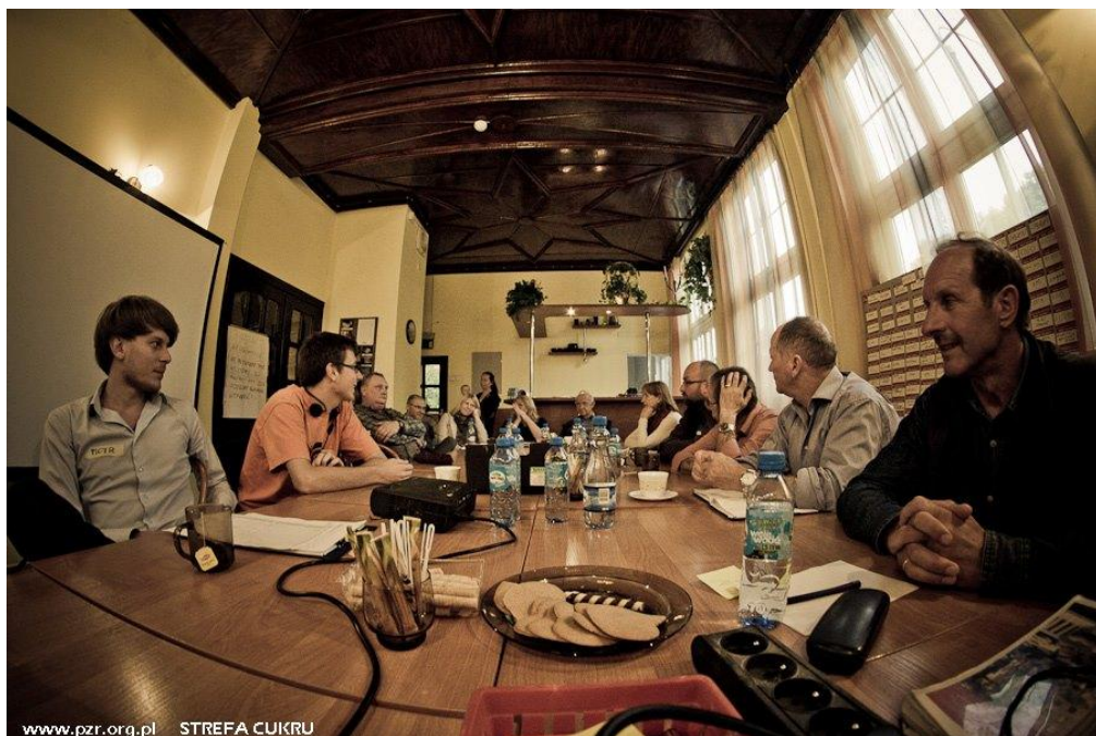
Strefa Cukru, 2012

Rozszerz swoją wiedzę przeprowadzając wywiady z wybranymi osobami.