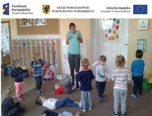
Projekt współfinansowany ze Środków Europejskiego Funduszu Społecznego w ramach Regionalnego Programu Operacyjnego dla województwa pomorskiego na lata 2014-2020