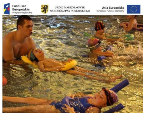
Projekt współfinansowany ze środków Europejskiego Funduszu Społecznego w ramach Regionalnego Programu Operacyjnego dla województwa pomorskiego na lata 2014-2020