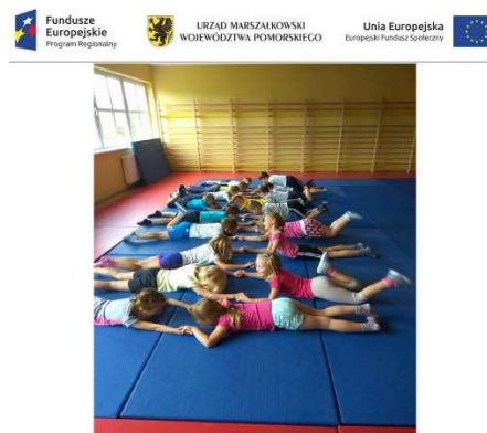
Projekt współfinansowany ze Środków Europejskiego Funduszu Społecznego w ramach Regionalnego Programu Operacyjnego dla województwa pomorskiego na lata 2014-2020