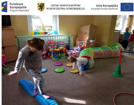
Projekt współfinansowany ze środków Europejskiego Funduszu Społecznego w ramach Regionalnego Programu Operacyjnego dla województwa pomorskiego na lata 2014-2020