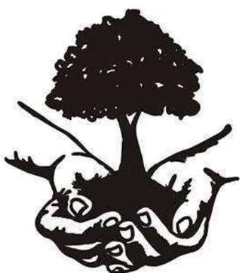
ŚRODOWISKOWY DOM SAMOPOMOCY w Osieku