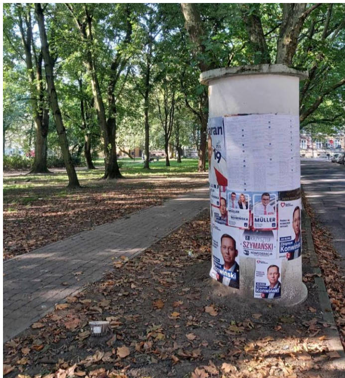
Społeczny monitoring materiałów wyborczych, 2023