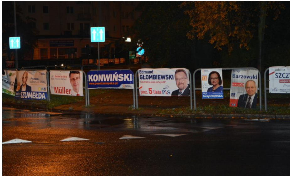
Fot. Stowarzyszenie Rozwoju INSPIRACJE, Społeczny monitoring materiałów wyborczych, 2015

Materiałem wyborczym jest każdy przekaz informacji, który pochodzi od komitetu wyborczego i został upubliczniony i utrwalony.