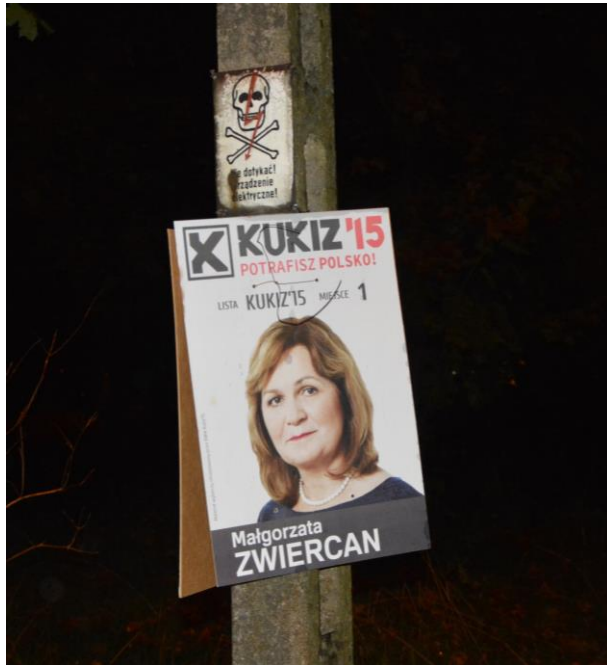
Fot. Stowarzyszenie Rozwoju INSPIRACJE, Społeczny monitoring materiałów wyborczych, 2015