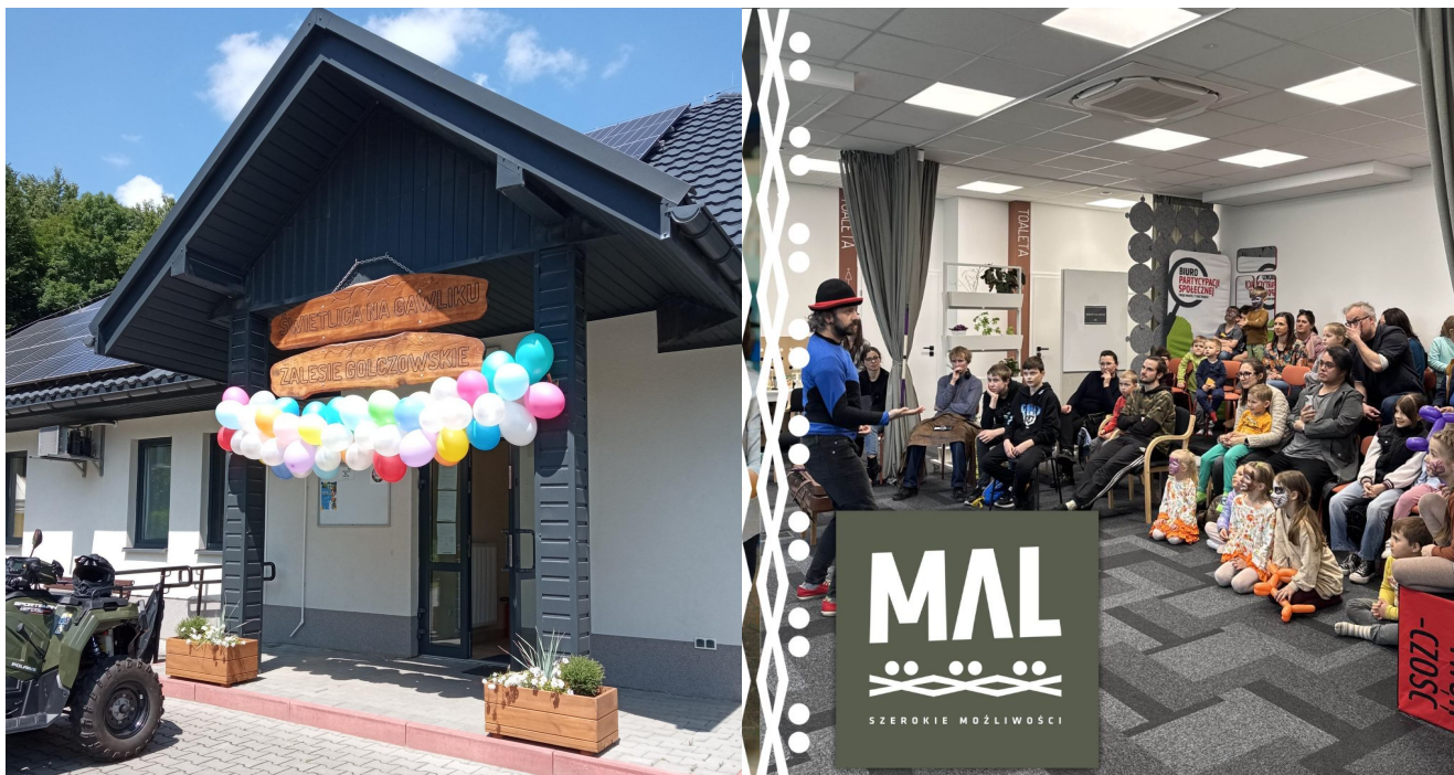
Wspólne miejsca sąsiedzkie