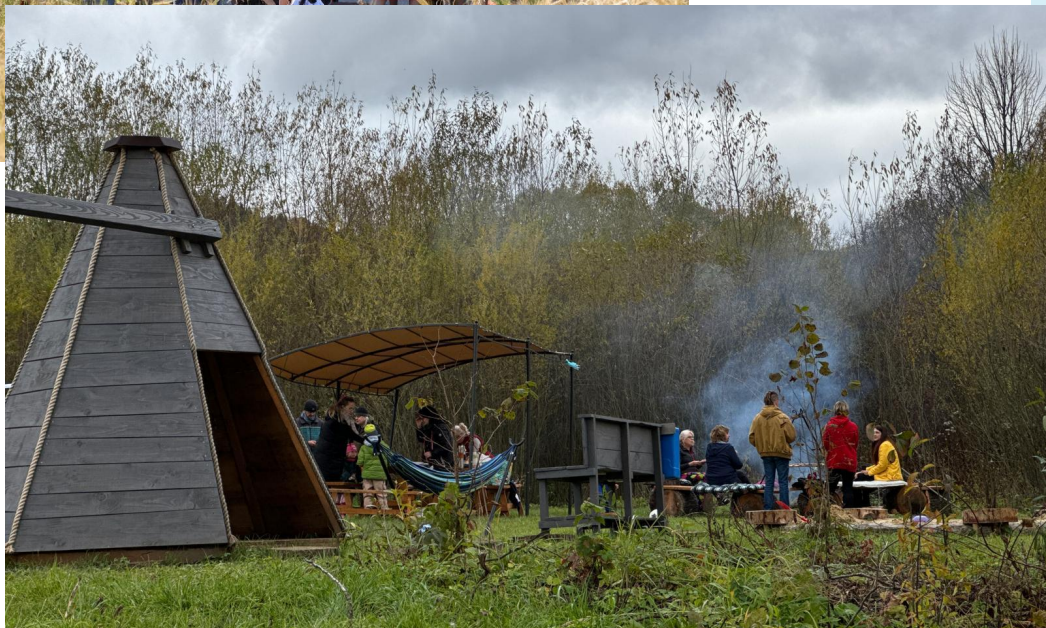
Przestrzenie półpubliczne osiedlowe