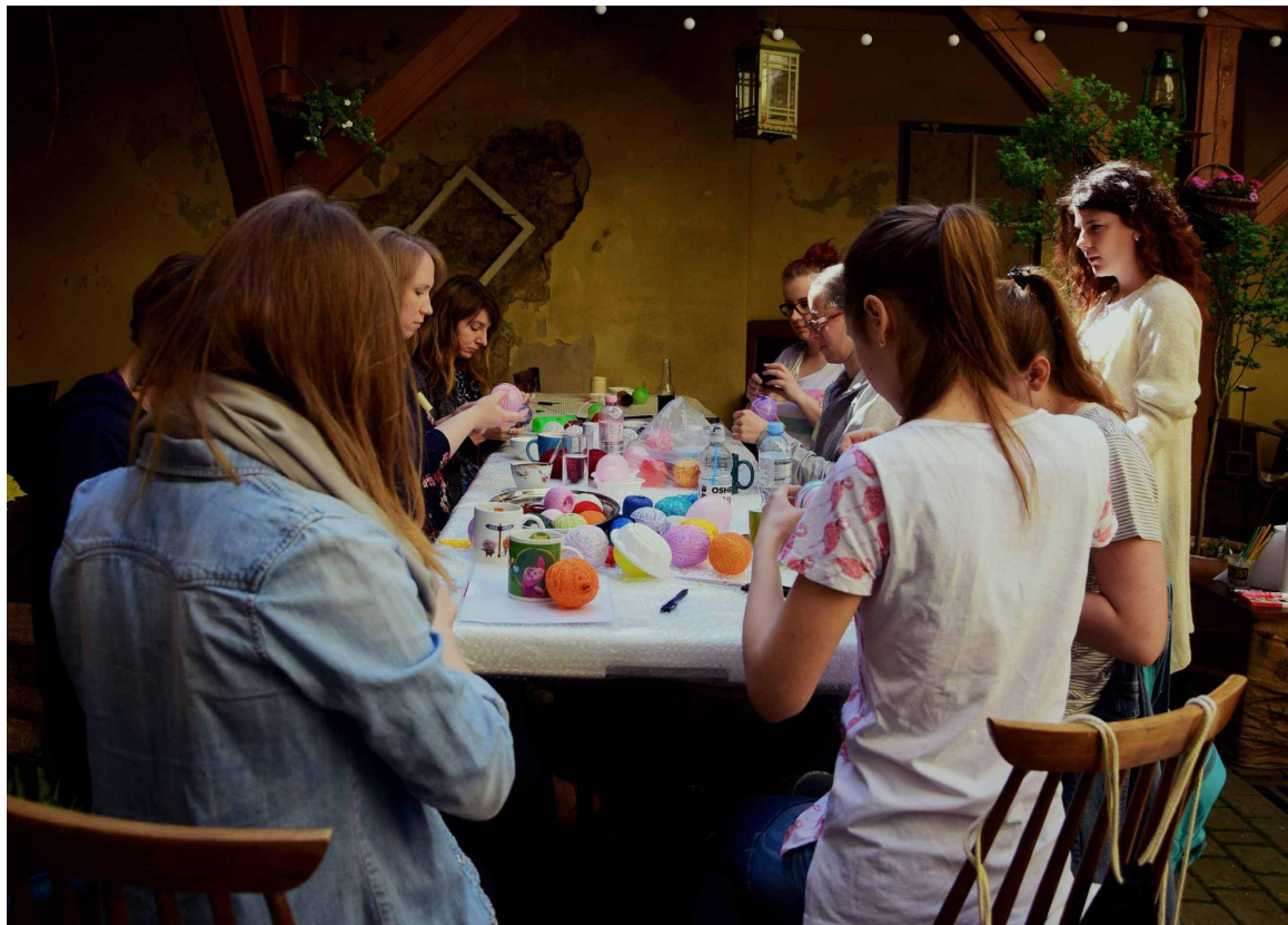
Miejsca hybrydowe (publiczno-komercyjne)